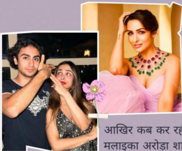
आखिर कब कर रही हैं मलायका अरोड़ा शादी?